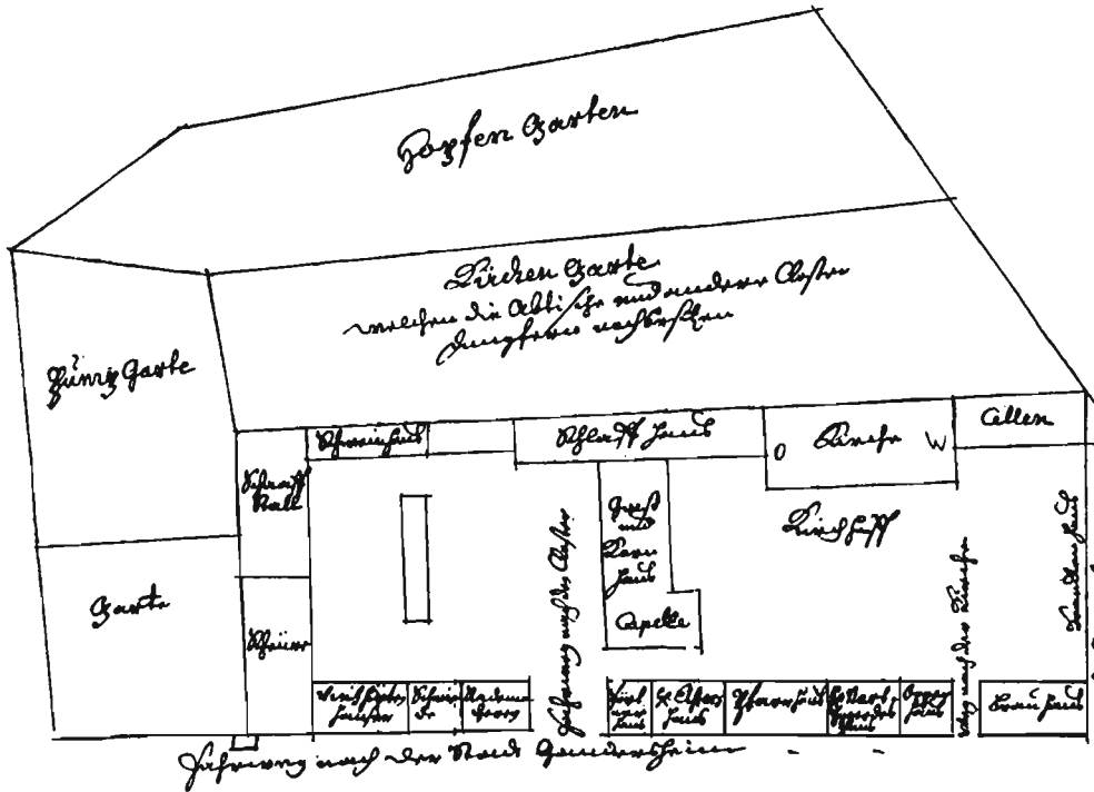
Schematisierte Lageskizze der Gebäude des ehemaligen Marienklosters aus dem Jahre 1571 von dem Klosterverwalter Zacharias Koch (Nachzeichnung des 18. Jhs. in 37 Alt 4040, verkleinert).

Im Kloster H. Marien von Gueden-Gräben in Wesseln zu dem Spiel der gemachten mit demselben Bienen aufgeführt von Zacharias Koch Klosterverwalter Marien Klosters A. 1571.